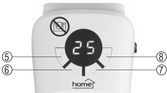
figure 2. • 2. ábra • 2. obraz • figura 2. • 2. skica • 2. obrázek • 2. slika